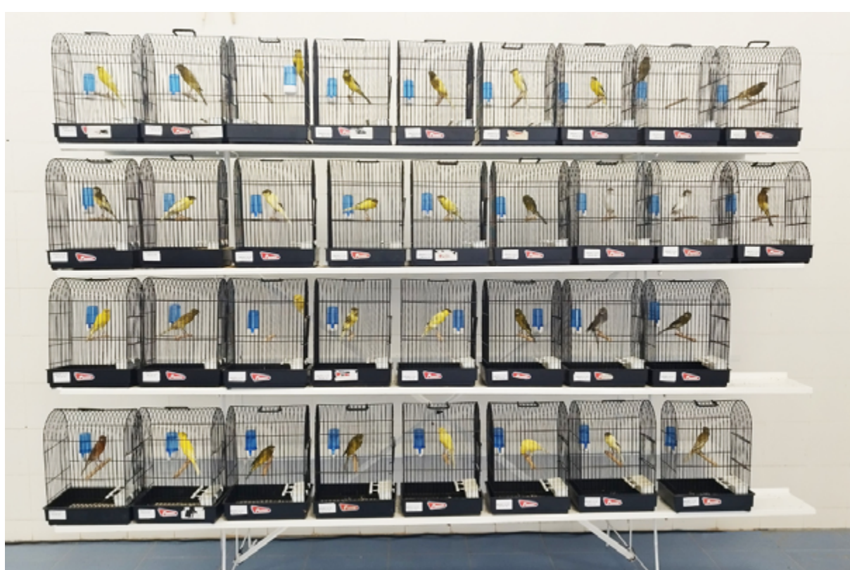
Fotografía de los llarguets con moña, presentados al evento.