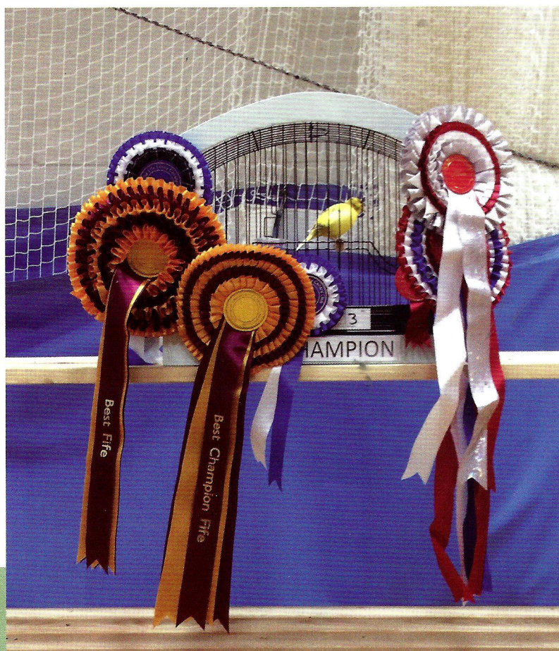
Mejor fife CHAMPION del concurso.

con las escárpelas, en función de los premios que ha obtenido.