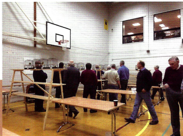
Jueces eligiendo el mejor fife.

Los jueces se disponen delante de unas estanterías, donde se van depositando con el máximo cuidado los ejemplares a enjuiciar, las jaulas nunca se cogen del asa superior, sino de los laterales de las mismas