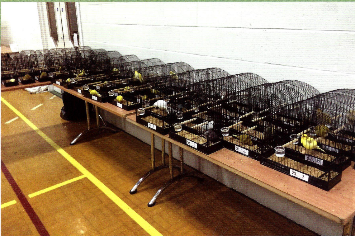
Los clasificados en primera posición de todas las gamas.

Los jueces se disponen delante de unas estanterías, donde se van depositando con el máximo cuidado los ejemplares a enjuiciar, las jaulas nunca se cogen del asa superior, sino de los laterales de las mismas