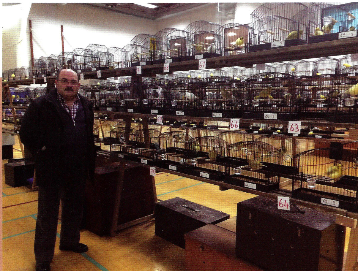
Vista de las disposición de las jaulas.

cierto es, que una serie de aspectos y técnicas tenían su razón de ser. En uno de los capítulos, comentaba que en el Norte del Reino Unido, se celebraba el mayor concurso de Fifes, donde solían acudir más de 1000 ejemplares procedentes de los mejores criadores de Escocia y Yorkshire, que